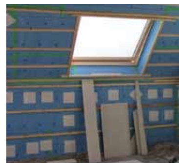
PAR L'INTERIEUR / EN PENTE