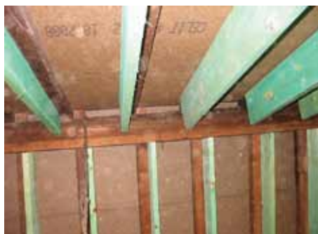
PAR L'INTERIEUR / EN PENTE